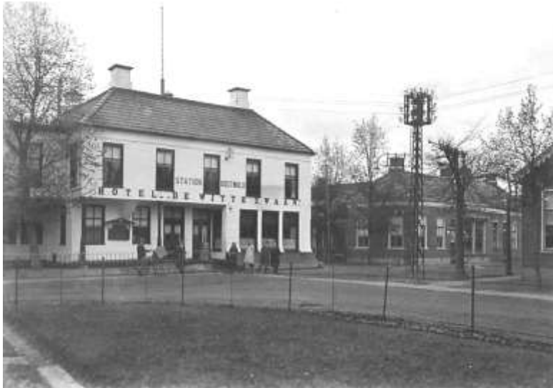
Hotel de Witte Zwaan, Oostwold