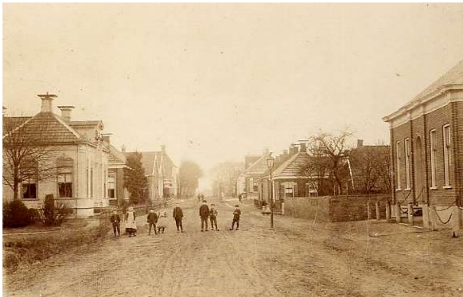
Midwolda, rechts was later de manufacturen-winkel van Uffen.